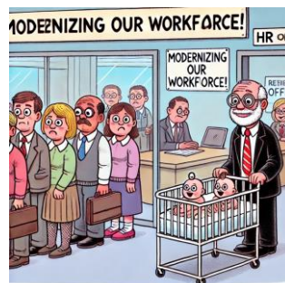
On a bien dit « Rajeunissez la pyramide des âges ? »

Et où est la diversité, où est l'égalité des chances, où est la non-discrimination vis-à-vis des seniors ??? Et on se vante d'avoir un bon score RSE ??