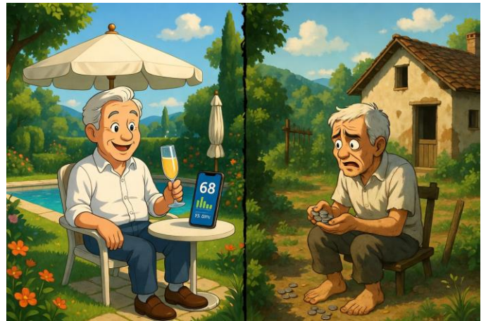
J'ai été bien conseillé pour ma retraite, finalement, et toi ?

Seniors : De façon schématique, le PERECO peut être très intéressant pour les seniors puisque la somme sera libérée peu de temps après.